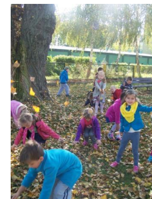
Bardzo lubimy zabawy w naszym ogrodzie przedszkolnym