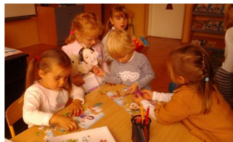
Układanie puzzli to nasze ulubione zabawy

„Jarzynowy wóz”- Średniaki – słoneczka wykonały ciekawe kukielki z warzyw, zachęcają wszystkich do ich jedzenia